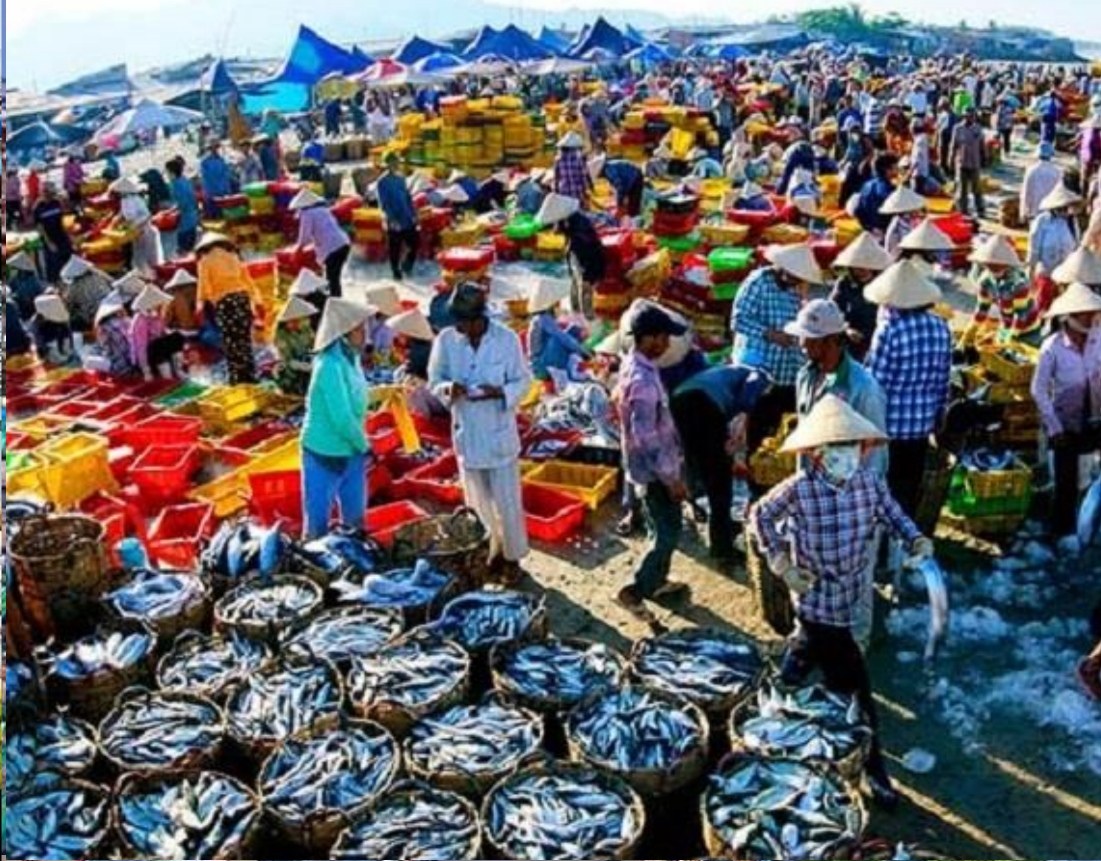
Chợ Hạ Long (Chợ Hòn Gai) ở Quảng Ninh